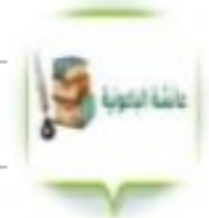
عائشة الباعونية الدمشقية