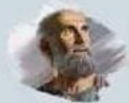
صفي الدين الحلي