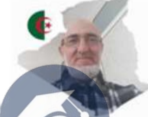
M. CHARIETE Med