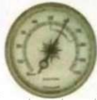
مقياس الرطوبة (يعبر عنها بالنسبة المئوية)