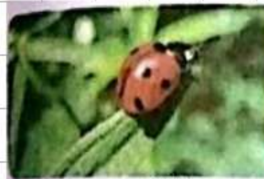
دعسوقة كائن حي حيواني