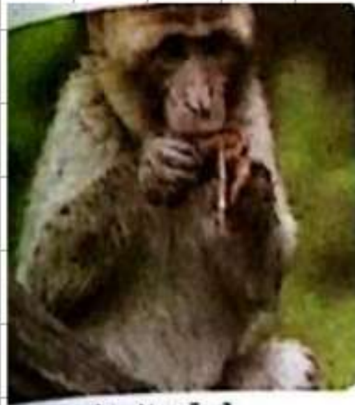
٣. قرد المافو

الكائنات الحية متنوعة تعيش في أوساط مختلفة