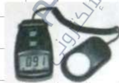
مقياس الإضاءة (وحداتها باللوكس lux)