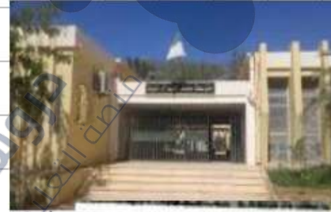
ركن طبيعي في متوسطة