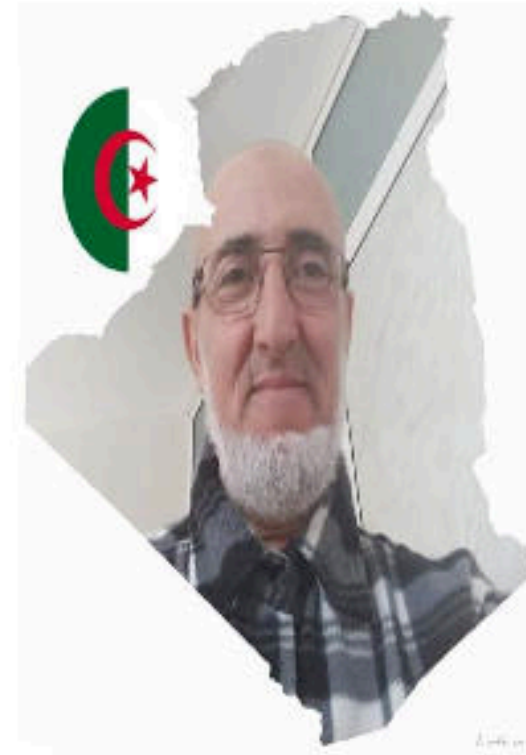
M. CHARIETE Med