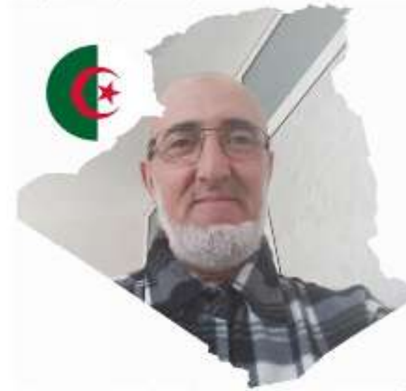
M. Med CHARIETE

Il est parfois difficile de distinguer la cause de la conséquence, donc voici un petit rappel.